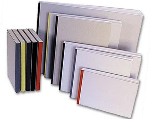
Skizzenbuch gebunden 15,0 x 12,0 cm; 4.79€ architekturbedarf.de